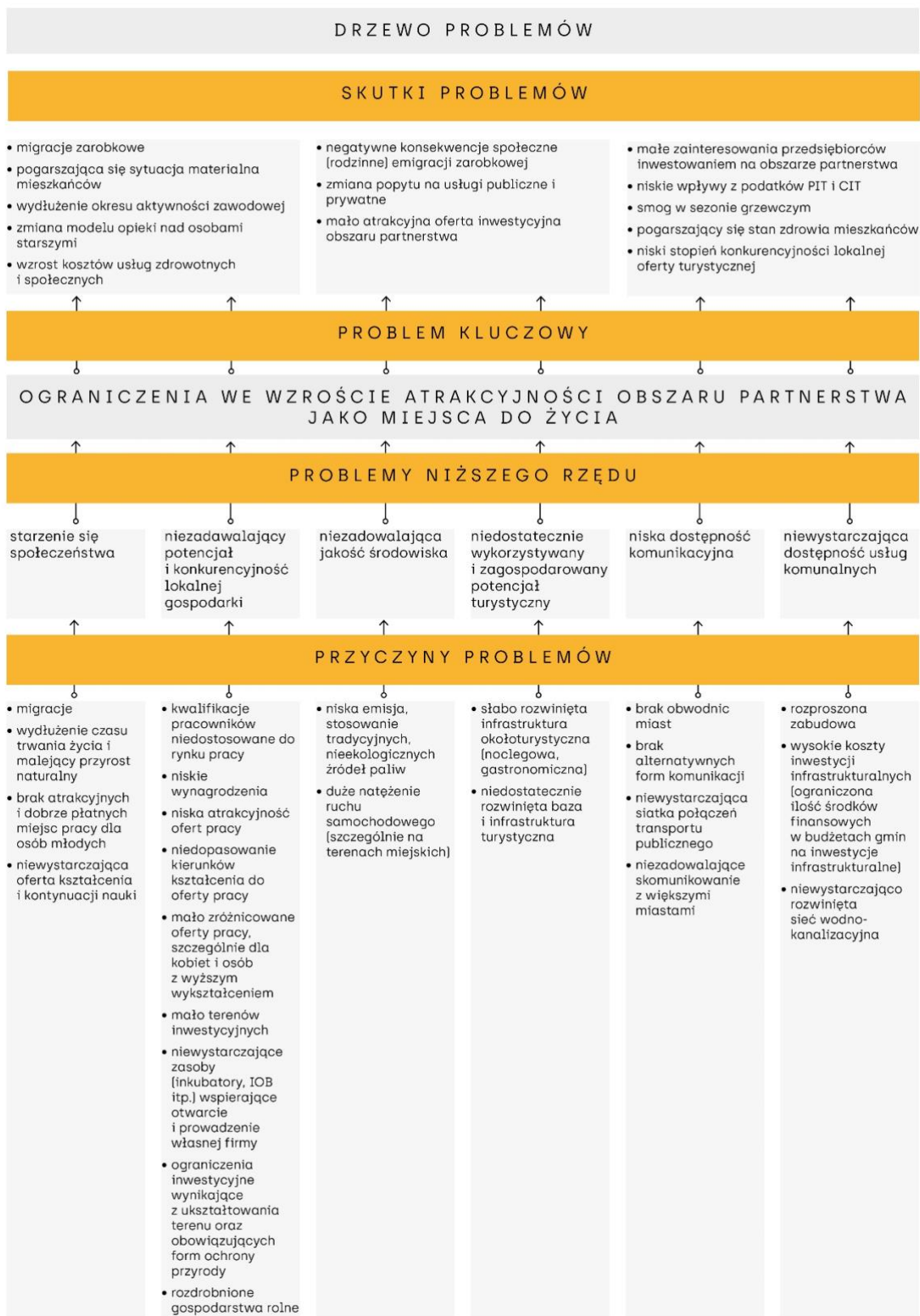
Rys. 2. Drzewo problemów