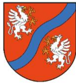
GMINA MSZANA DOLNA