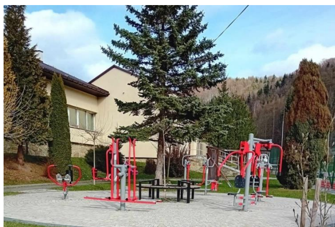
Siłownia zewnętrzna w Kamionkce Małej