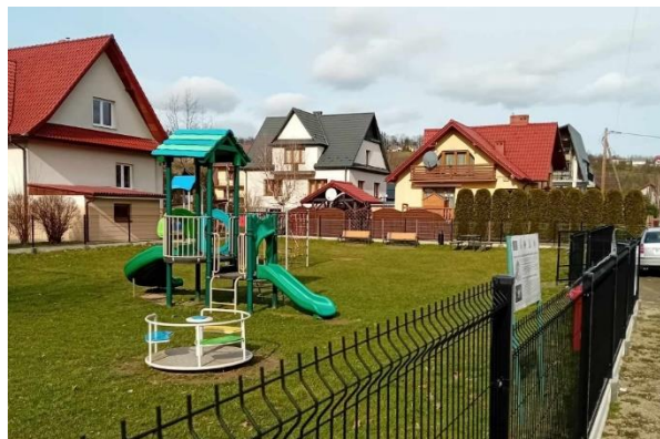
Plac zabaw w Ujanowicach