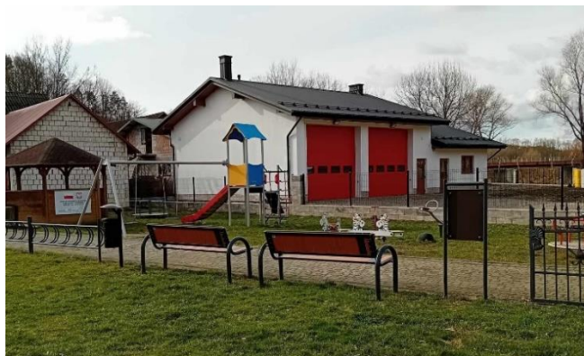
Plac zabaw w Strzeszycach