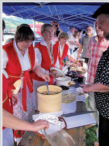
Koło Gospodyń Wiejskich z Kamionki Małej - Ciasto drożdżowe ze śliwką - Starodawne jadło „Kapusta ze śliwą”