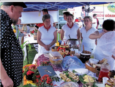
Koło Gospodyń Wiejskich z Laskowej - Placek „Smacześliwka” - Schab ze śliwką w sosie musztardowo – miodowym