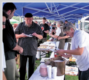
Koło Gospodyń Wiejskich ze Strzeszyc - Sernik z kokosem - Pierogi z suszoną śliwką