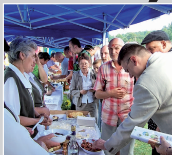
Koło Gospodyń Wiejskich z Krosnej - Zakąska „Śliwka z boczkiem”